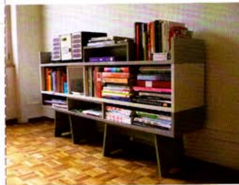
▲安卓亞斯'08年創作的Stackable Sideboard能夠隨著使用者的需求而變化層架組合方式，十足的使用彈性無形中增加家具本身的使用價值與多元彈性。