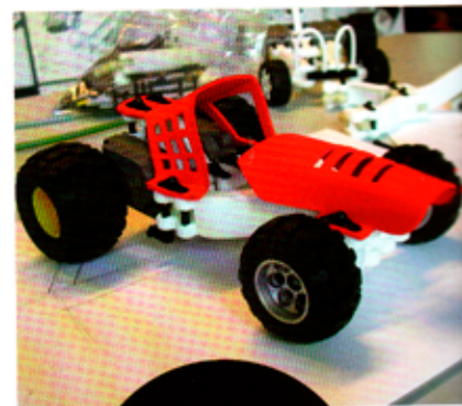
從草圖到成品，安卓亞斯追求一絲不苟的絕對品質要求！